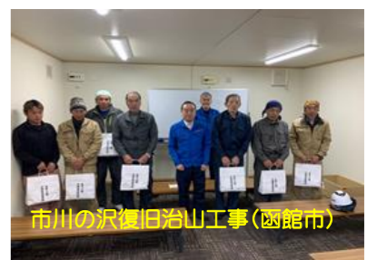
市川の沢復旧治山工事(函館市)