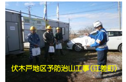
伏木戸地区予防治山工事(江差町)