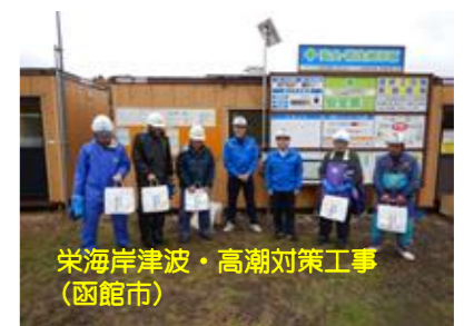
栄海岸津波・高潮対策工事(函館市)