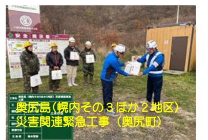
奥尻島(幌内その3ほか2地区) 災害関連緊急工事(奥尻町)