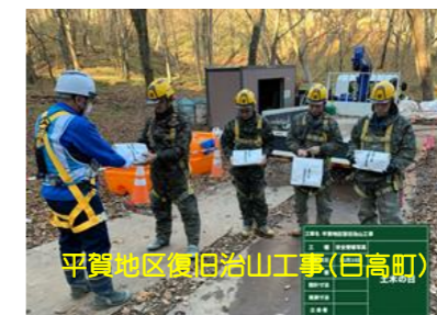
平賀地区復旧治山工事(白高町)