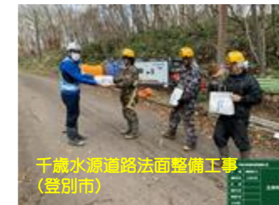
千歳水源道路路面整備工事(登別市)