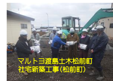
マルトヨ渡島土木松前町 社宅新築工事(松前町)