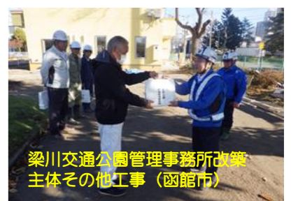
梁川交通公園管理事務所改築主体その他工事(函館市)