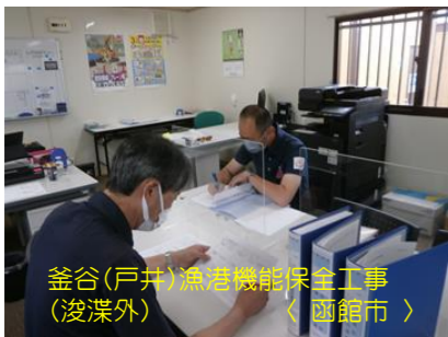
釜谷(戸井)漁港機能保全工事 (浚渫外) 〈函館市〉

当社は ISO9001(品質)、ISO14001(環境)、ISO45001(労働安全衛生)の要求事項に従って必要なプロセス及び相互作用を含む統合マネジメントシステムを職員が監査員を務め、年2回内部監査を行っています。職員同士が互いの施工活動を監査することで、ISO規格への理解を深めるとともに、自からの施工活動で不十分な点を見出すのに役立っています。