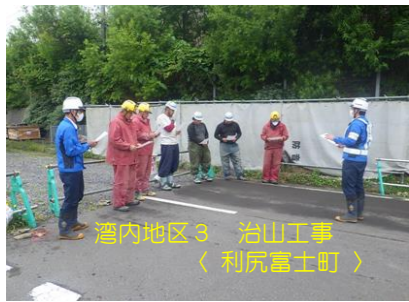
酒内地区3 治山工事 〈利尻富士町〉