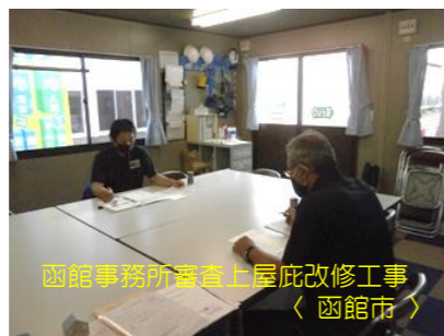
函館事務所審査上屋庇改修工事 〈函館市〉