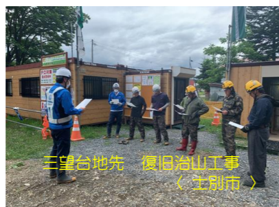
三望台地先 復旧治山工事 〈士別市〉