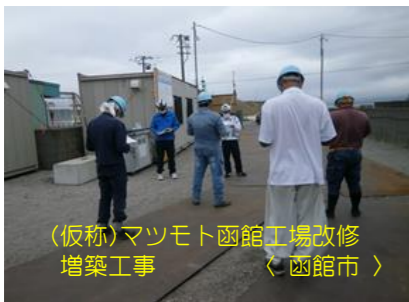
(仮称)マツモト函館工場改修 増築工事 〈函館市〉