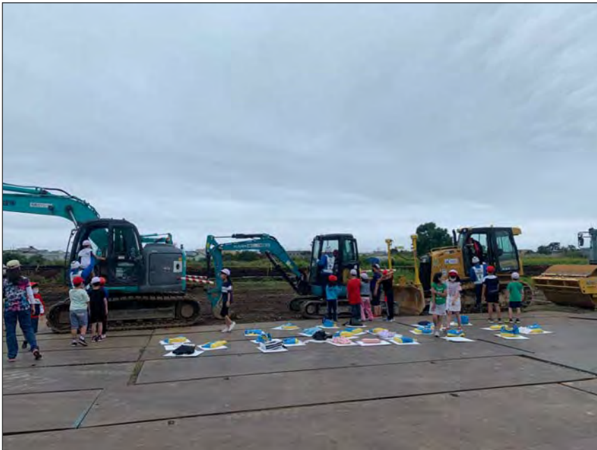
写真区分:その他 工種:200821_上湯川小学校_ 地域貢献 タイトル:重機試乗会