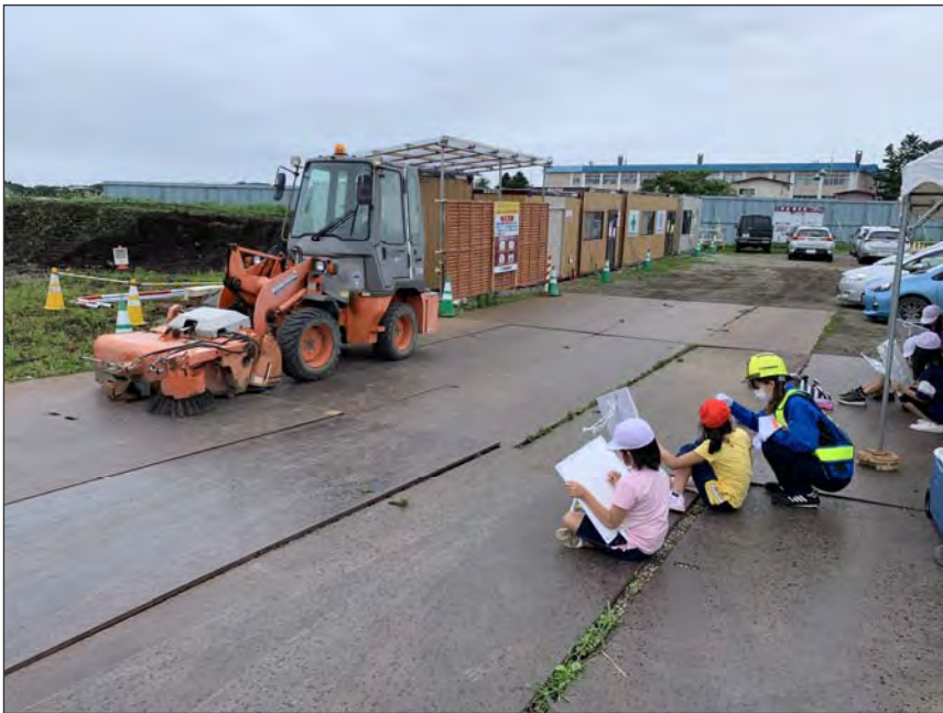
写真区分:その他 工種:200821_上湯川小学校_ 地域貢献 タイトル:重機写生会