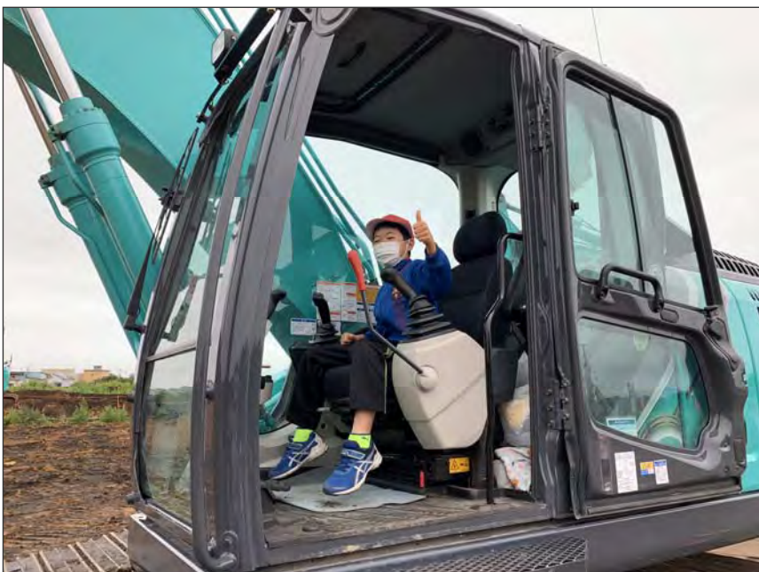
写真区分:その他 工種:200821_上湯川小学校_ 地域貢献 タイトル:重機試乗会