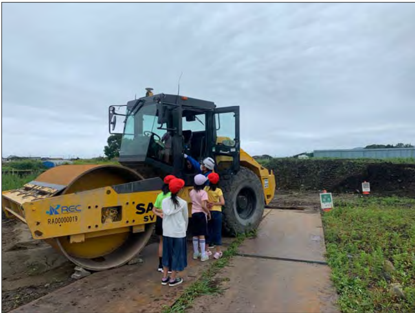
写真区分:その他 工種:200821_上湯川小学校_ 地域貢献 タイトル:重機試乗会