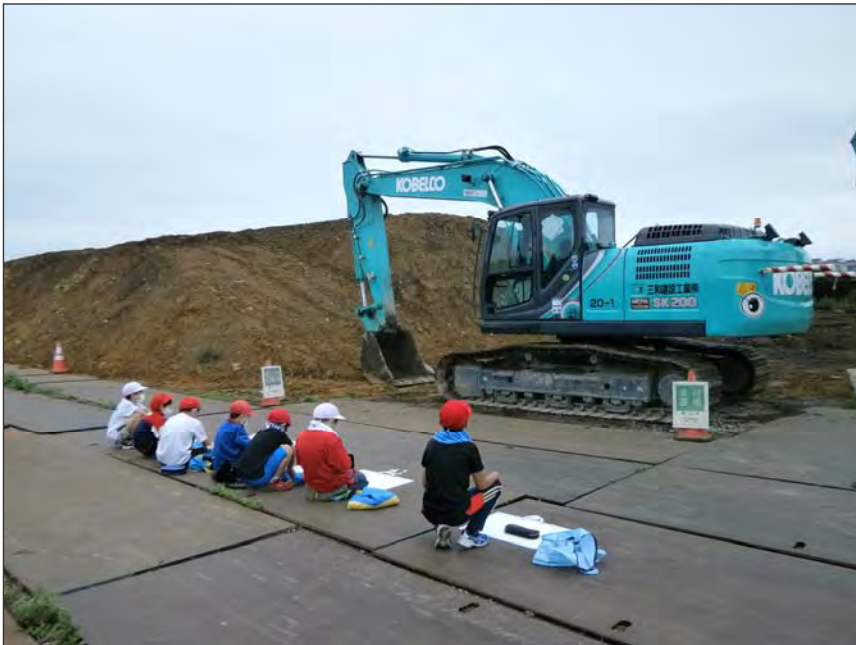
写真区分:その他 工種:200821_上湯川小学校_ 地域貢献 タイトル:重機写生会