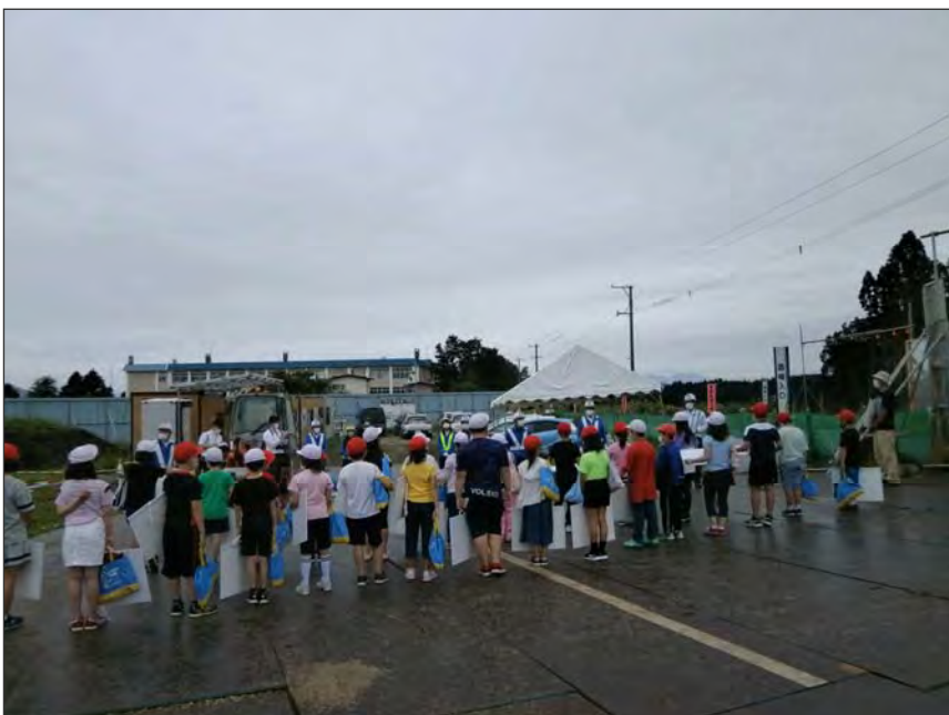
写真区分:その他 工種:200821_上湯川小学校_ 地域貢献 タイトル:開会集合