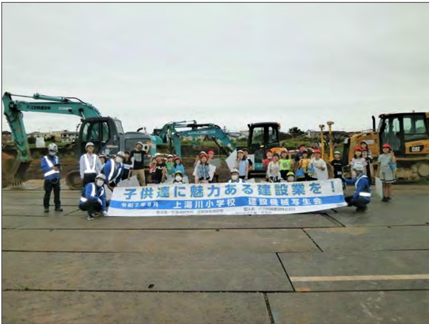
写真区分:その他 工種:200821_上湯川小学校_ 地域貢献 タイトル:集合写真