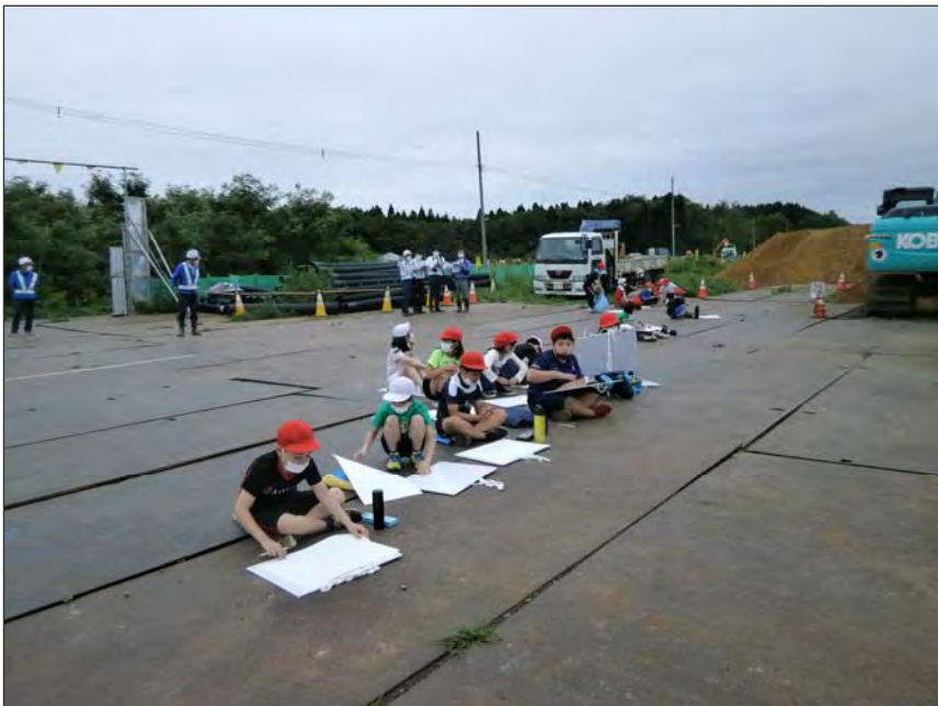
写真区分:その他 工種:200821_上湯川小学校_ 地域貢献 タイトル:重機写生会