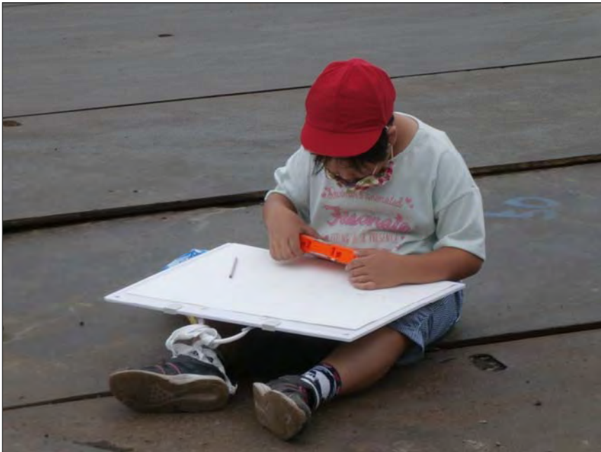
写真区分:その他 工種:200821_上湯川小学校_ 地域貢献 タイトル:重機写生会