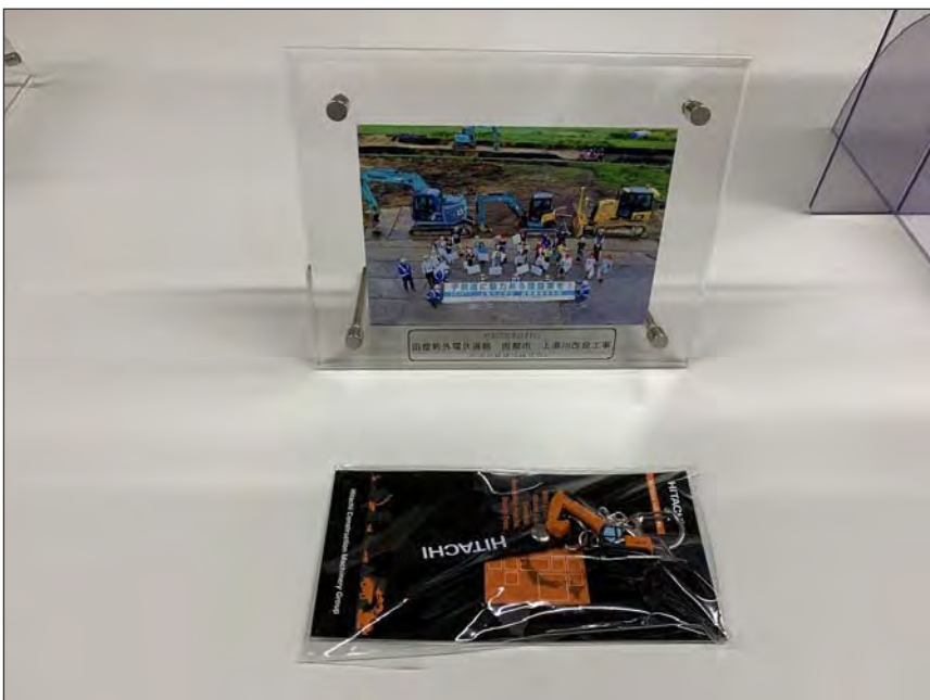
写真区分:その他 工種:200821_上湯川小学校_ 地域貢献 タイトル:記念品(集合写真と重機ストラップ)