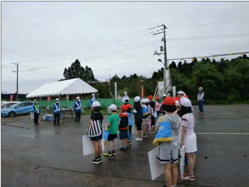
写真区分:その他 工種:200821_上湯川小学校_ 地域貢献 タイトル:開会集合