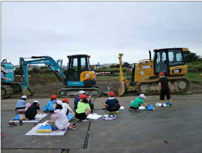
写真区分:その他 工種:200821_上湯川小学校_ 地域貢献 タイトル:重機写生会