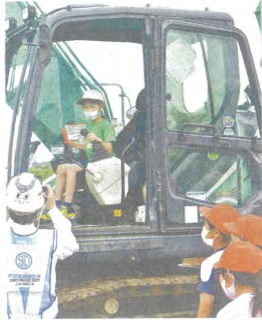
重機に試乗する児童