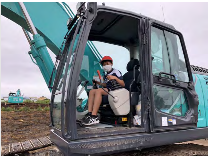
写真区分:その他 工種:200821_上湯川小学校_ 地域貢献 タイトル:重機試乗会