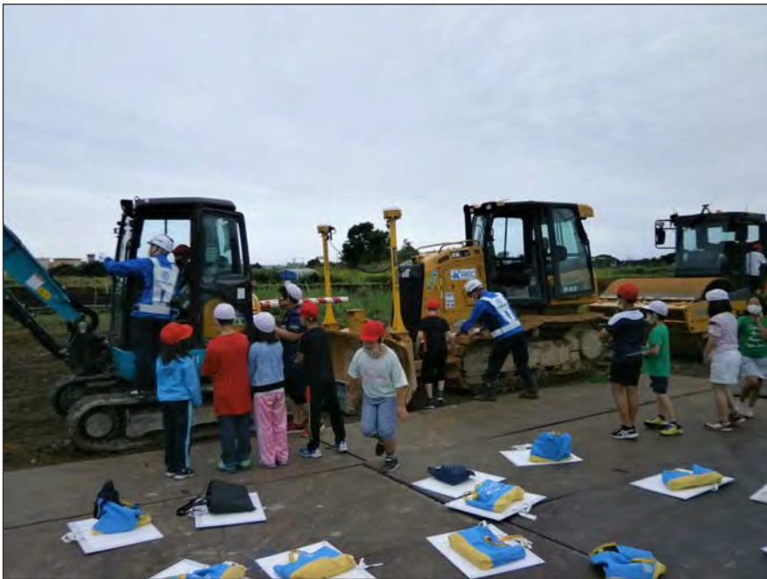
写真区分:その他 工種:200821_上湯川小学校_ 地域貢献 タイトル:重機試乗会