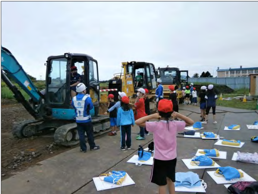
写真区分:その他 工種:200821_上湯川小学校_ 地域貢献 タイトル:重機試乗会